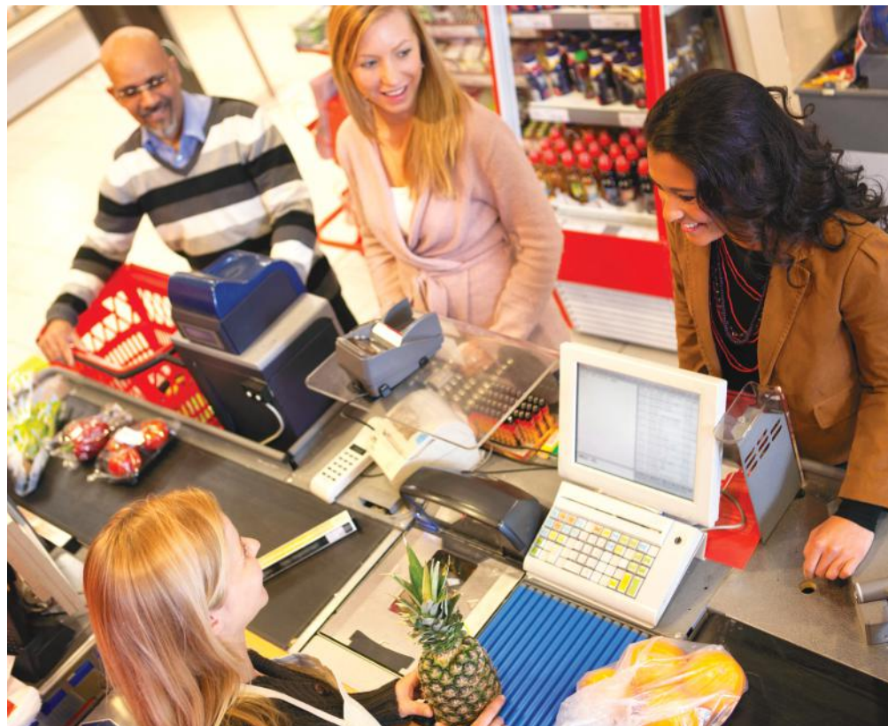
Fontos, hogy a pult mögött álló szakember empátikus legyen, a vevő érezze, hogy foglalkoznak vele

– Alapjában véve azt gondolom, hogy az életben is akkor boldogulunk igazán, ha figyelünk egymásra, együttműködők és kedvesek vagyunk. Ez az elv a kereskedelemben hatványozottan igaz – véli a testület elnöke.