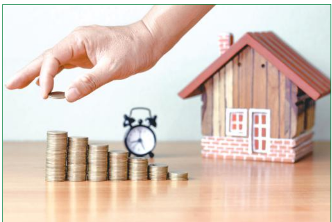
2023-ig maradhat a kedvezményes, öt százalékos lakásáfa