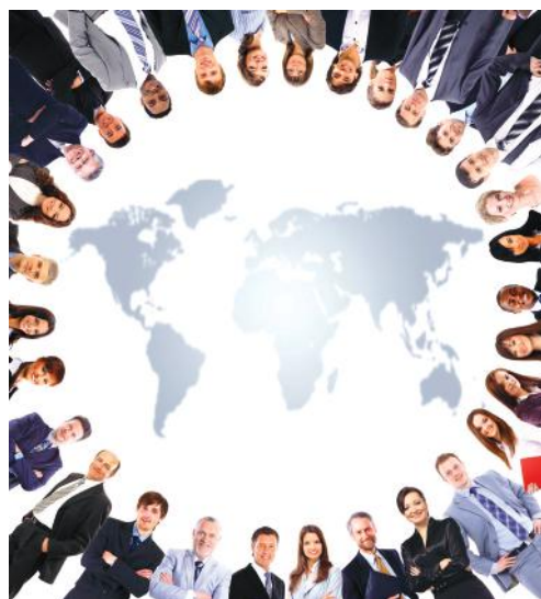
Bécs, 2018. december 4. és 6.: Horizon 2020 infokommunikációs technológiai üzletember-találkozó

Az Európai Bizottság által szervezett ICT konferenciára több ezer ICT szakembert vár-