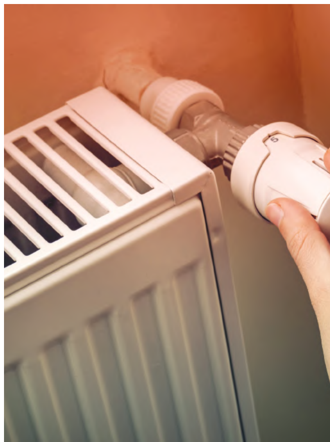
A fűtési szezon megkezdődött, fontos ellenőriztetni a tüzelőberendezéseket