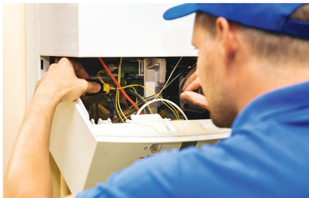
Nem szabad félvállról venni az ellenőrzést!

Aki most kér időpontot az évenkénti karbantartásra, annak körülbelül egy hetet kell várnia a kéményseprőre. Amennyiben egy új készülék behelyezéséről van szó – mivel itt egy alaposabb vizsgálat szükséges – közel három hét a várakozási idő.