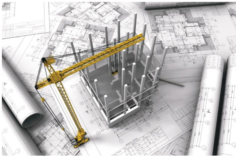
2023-ig marad a kedvezményes lakásáfa az építési engedéllyel rendelkező ingatlanokra

2019. december 31-ét követően azoknál az új lakóingatlanoknál alkalmazható az öt százalékos mértékű áfa, amelyek építésére 2018 november 1-jén már van végleges építési engedély, vagy - a 300 négyzetméter alatti lakóingatlanok esetében - az építést addig bejelentették. A kedvezményes adómérték ebben az esetben is csak akkor alkalmazható, ha legkésőbb 2023. december 31-én eladják az új lakást.