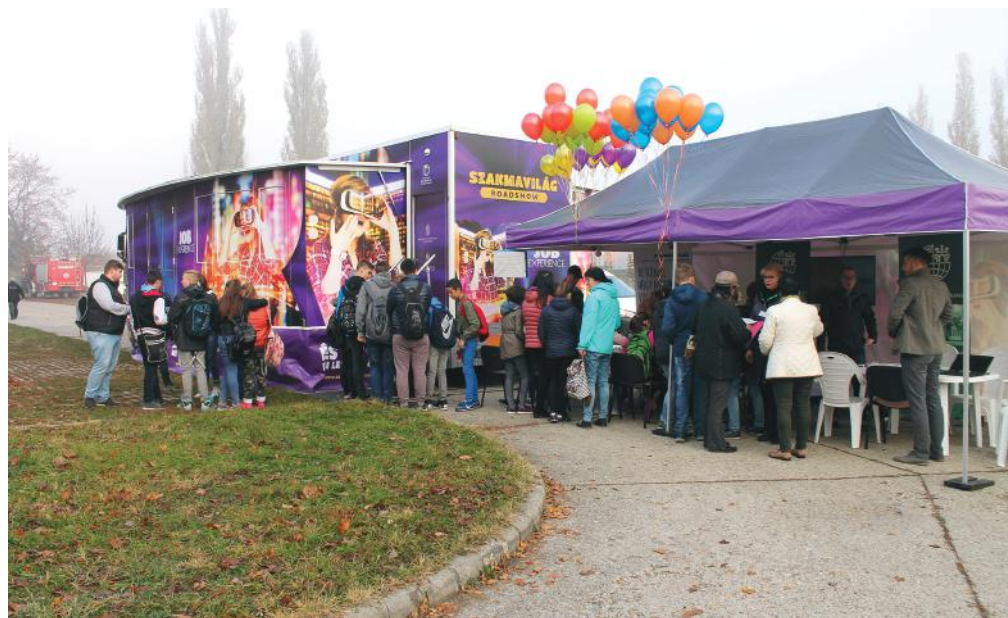
A „Szakmavilág” roadshow kamion többszáz diákot vonzott Fejér megyében, Székesfehérváron

A program NFA-KA-NGM-3/2017/TK/07 támogatási szerződés alapján valósult meg.