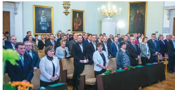
Öt szakmában, harminchárom új mester vette át mesteroklevelét

22 fő mesterképzése az NFA-KA-NGM-3/2017/TK/07 projekt keretében valósult meg.