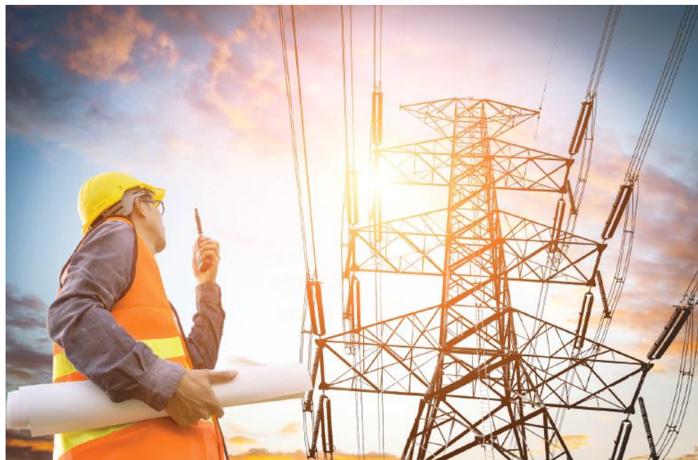
Ma Magyarországon a lakosság pozitívan kivételezett energiafogyasztó

– A szilárd tüzelés esetében különös figyelmet kell fordítani a faanyagra. Ha nem volt elég ideje kiszáradni, akkor tüzelés során kicsapódik a víz a fából, és pár hét alatt olyan mennyiségű kátrány rakódhat le a kéményben, mely intenzív tüzelés esetén begyulladhat. Ebből az okból keletkezik a