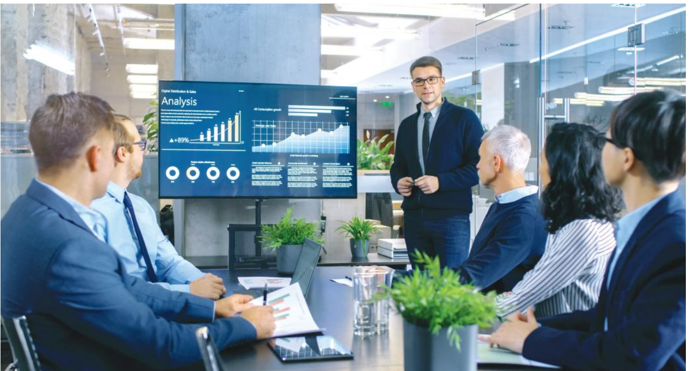
Készülő kkv stratégia: a magyar vállalkozók generációváltását és a kkv-k digitalizációs előrelépését támogatja

A KKV stratégia fórumon ipari termelő, szolgáltató, kereskedő és turizmus ágazatokból vettek részt vállalkozásvezetők, köztük többen generációváltó gazdálkodók, fiatal vállalkozók, ill. exportképes vállalatok.