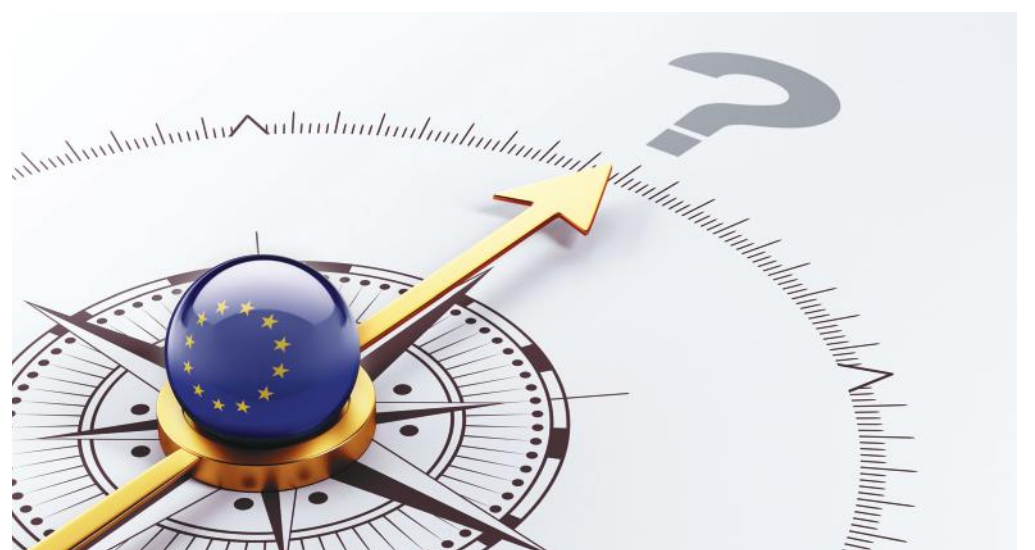
Hazánk tizenöt évvel ezelőtt, 2004. május 1-jén, kilenc másik országgal együtt csatlakozott az Európai Unióhoz

Az Unió vállalkozáspolitikájának középpontjában a vállalkozások versenyképességének erősítése, továbbá a gazdasági növekedés előmozdítása és a munkahely-