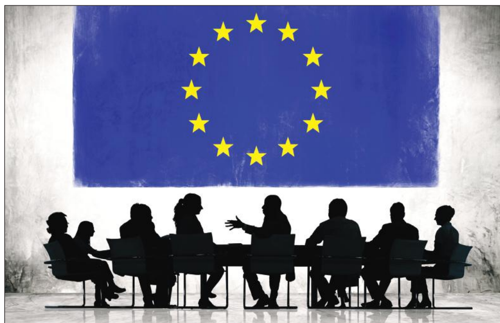
Az Enterprise Europe Network a világ legnagyobb üzletfejlesztési hálózata

Bővebb információ: www.fmkik.hu , enterpriseenurope.hu , 22-510-310, een@fmkik.hu .