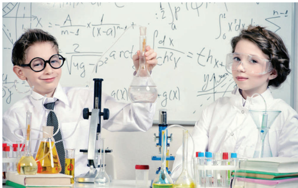
Üzem-és tanműhelylátogatásokra várjuk a diákokat