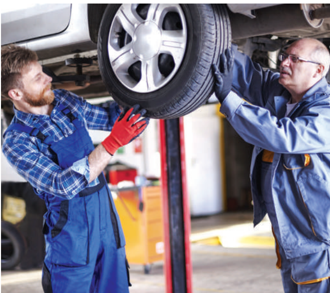
Sok képzés megszűnik, vagy módosul szeptembertől

Mind a szakképző iskola, mind a technikum ágazati alapoktatással indul, amennyiben a tanuló váltani szeretne a két iskolatípus között, az összehangolt ágazati tartalomnak köszönhetően az ágazati alapok megszerzése után megteheti. Az ágazati alapoktatást követően a szakma kiválasztását követően kezdődik el a szakirányú oktatás. A szakképzésben résztvevő tanu-