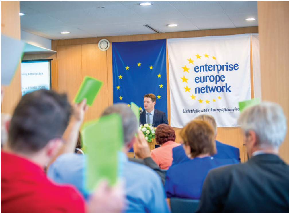
A küldöttek elfogadták a mérlegbeszámolót és a 2020. évi üzleti tervet

Az ünnepélyes részt követően a kamara küldöttei megtárgyalták az FMKIK 2019. évi munkaterv és a költségvetés teljesítéséről szóló beszámolót, az FMKIK 2019. évi mérlegbeszámolóját és eredmény kimutatását, valamint a 2020. évi szakmai és költségvetési üzleti tervet.