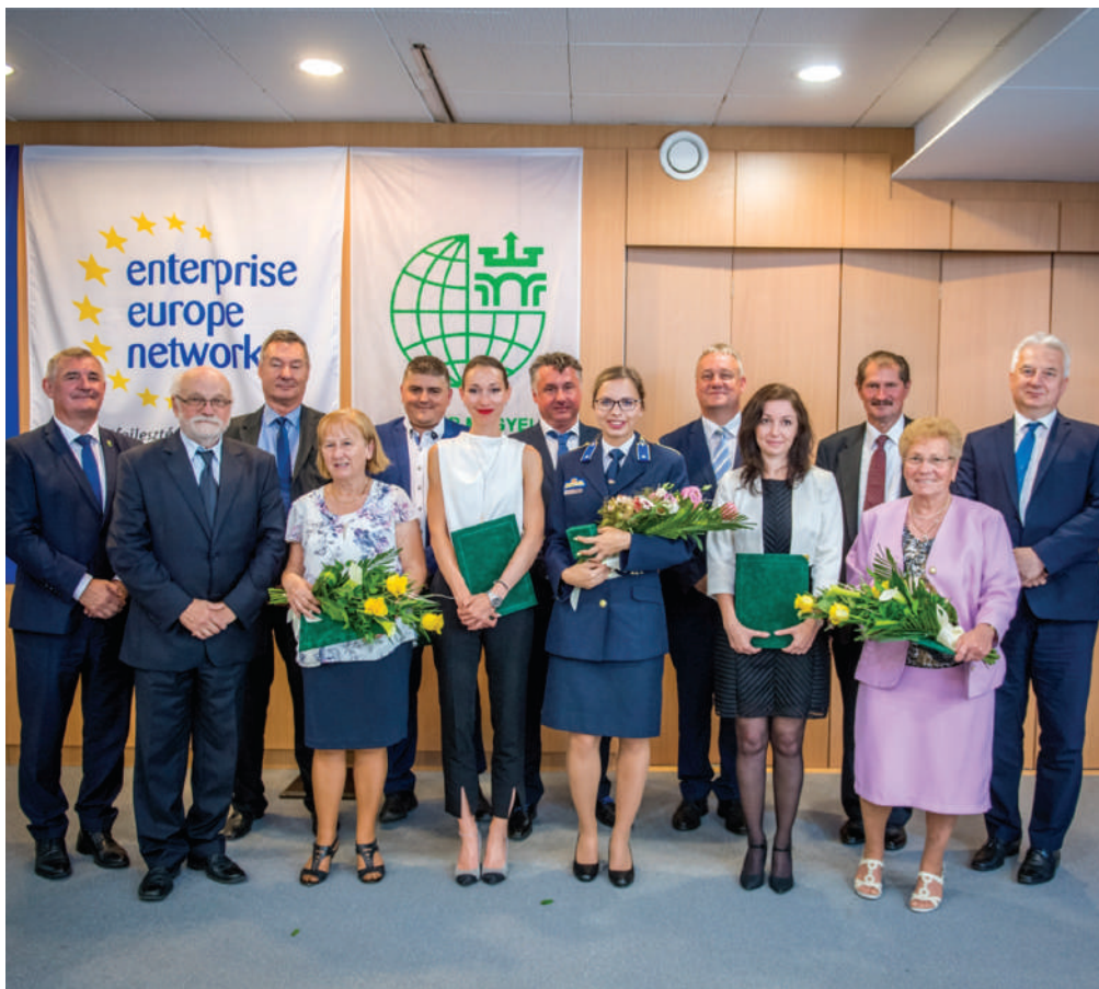
Az FMKIK hét díjat adományozott, kilenc példaértékű tevékenységet végző gazdasági szereplő részére

A Kamara, mely megalakulása óta megtartotta a nevét, szilárdan épít a múltira, a hagyományokra, és képes a folyamatos megújulásra, alkalmazkodásra, az új befo-