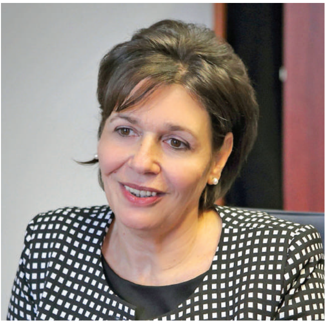
Pölöskei Gáborné, szakképzésért felelős helyettes államtitkár, Innovációs és Technológiai Minisztérium

A felnőttoktatás is az eddigieknél rugalmasabban valósulhat meg, mind a képzés időtartamát, mind szervezését illetően. A képzési idő lerövidíthető, a szakirányú oktatás akár a képzés-