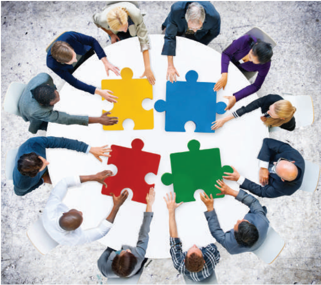
Az Ön cégét is érinthetik a felnőttképzési változások

A legjelentősebb változás, hogy minden szervezett, célirányos kompetenciakialakításra és kompetencia-fejlesztésre irányuló, szervezetten megvalósuló oktatás és képzés felnőttképzési tevékenységnek tekintendő, és kiterjed rá az Fktv. hatálya. Beleértve a jogszabály alapján folytatott – korábban hatósági, hatósági jellegű képzéseket, és a munkáltatók által saját munkavállalóik számára, nem üzletszerűen folytatott belső képzéseket. Felnőttképzési tevékenység keretében megvalósítandók az ITM tájékoztatása szerint a munkavállalók számára szervezett munkavédelmi és tűzvédelmi képzések is. A felnőttképzési tevékenység a szolgáltatási tevékenység megkezdésének és folytatásának általános szabályairól szóló törvény szerint bejelentés alapján végezhető. A bejelentési eljárást a felnőttképzési tevékenységet folytató munkál-