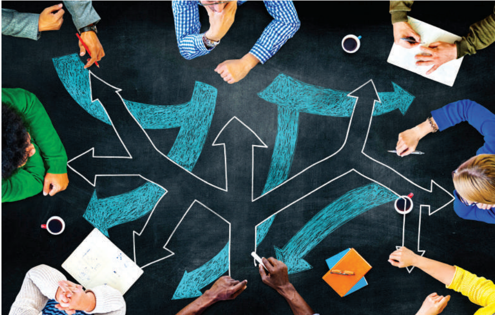
Az Ön sikeréért: megoldásvezérelt szolgáltatások, az üzleti innováció támogatása

jékoztatja az elnyert összeg optimális felhasználásáról, a további lehetőségekről. A hálózat további szolgáltatásai: nemzet-közi üzleti partneri kapcsolatok létrejötté-nek támogatása szaktanácsadással, EU-s jogszabályokhoz, a határon átnyúló szol-gáltatásnyújtás szabályaihoz, finanszírozási kérdésekhez, szellemi tulajdonvédelemhez kapcsolódó tanácsadás, megoldásvezérelt szolgáltatások, az üzleti innováció támogatá-sa, hogy innovatív ötletből nemzetközi üzleti siker legyen, online adatbázis, ahova díjmen-tesen kerülhetnek be a vállalkozások. Szolgáltatásaink térítésmentesen állnak rendelkezésére. Keressen bennünket! fmkik.hu, een@een.hu, 22-50-310