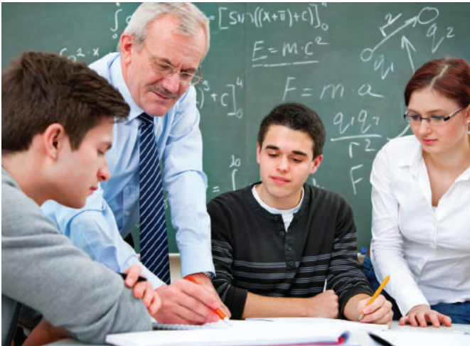
Folyamatosan tájékoztatunk az átalakításról

A kamara 2020-ban szakképzési fórum rendezvények keretében folyamatosan tájékoztatja a gazdálkodókat az új rendszer tartalmi elemeiről, illetve a duális képzési tanácsadók képzőhely látogatás keretében adnak felvilágosítást a változásokról. A tájékoztatás az NFA-KA-ITM-16/2019/TK/07 számú támogatási szerződés keretében valósul meg.