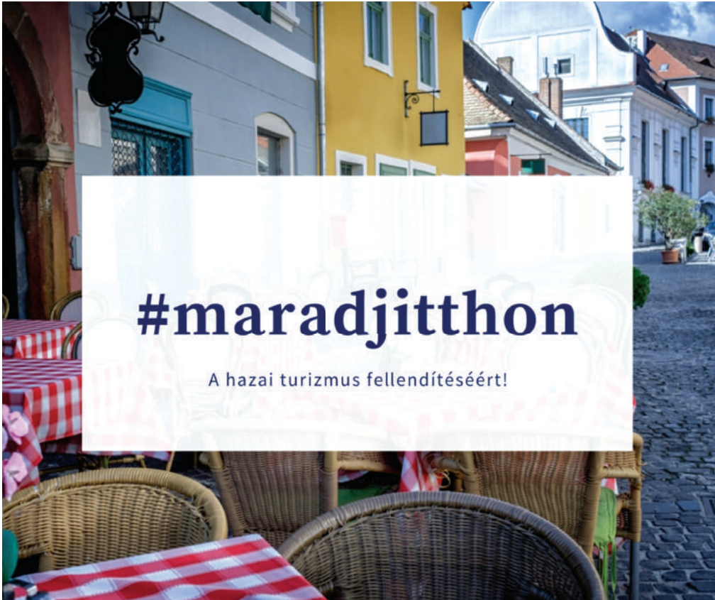
Morálisan is jótékony céllal a vendéglátás és a turizmus támogatásáért

Kiskakas Étterem és Diófa Étterem – Székesfehérvár Novotel – Székesfehérvár Pokol Pince Étterem – Szabadbattyán Vértess Vendéglő és Fogadó – Gánt Elérhetőség: fmkik.hu