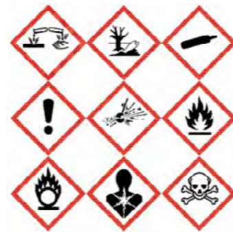
veszélyt jelző pictogramok