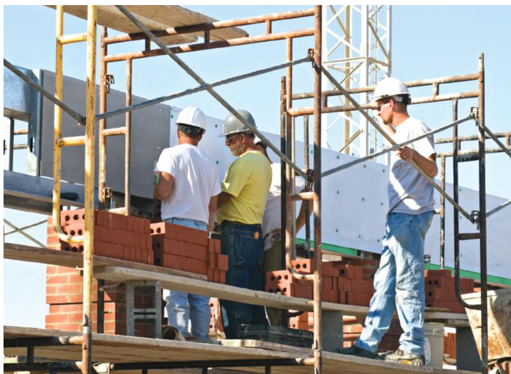
2020. január 1-jétől ismét 27%-os áfakulcsot kell alkalmazni az új lakóingatlanok értékesítésére

A KNE épületek magasabb minőségi elvárását jelentenek. 2021-től már lakóházakra is alkalmazandó közel nulla energiaigényű épületek esetében az energetikai besorolásnak – új épületek esetén – BB szintnek kell megfelelni.