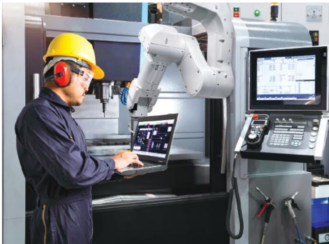
Várjuk a duális képzőhelyek jelentkezését programunkra

A programsorozat három részből áll. Először a duális képzőhelyek a szakképzési munkaszerződés tartalmi elemeivel ismerkedtek meg. Második alkalommal a duális képzőhelyek online tájékoztató keretében, információt kapnak 2021. február 24-én, a szakirányú oktatás finanszírozási rendszeréről. A har-