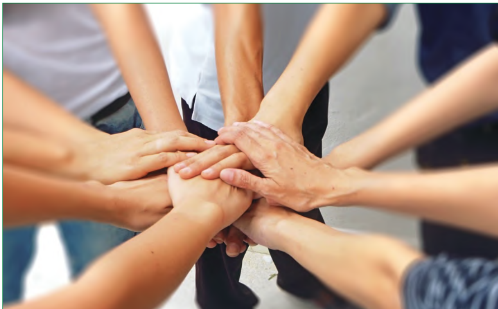
A Mentorprogramban a pandémiás helyzet lecsengéséig online térbe helyezték át a találkozókat

A Mentorprogramhoz a tervek szerint lehet még csatlakozni késő tavasszal egy új pénzügyi és vállalkozói szemléletformálási alprojekt keretein belül, amely az első 1500 jelentkező számára térítésmentesen lesz elérhető. Bővebb információ: www.vallalkozztudatosan.hu