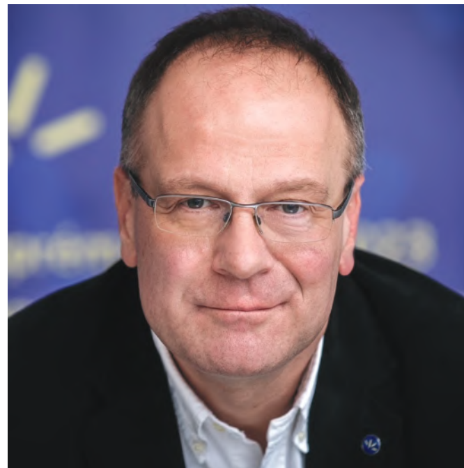
Navracsics Tibor kormánybiztos

A gazdasági övezet fejlesztésében prioritást kapnak a közlekedés és az infrastruktúra fejlesztések – hangsúlyozta Navracsics Tibor a találkozáson. Kiemelte továbbá, hogy az Észak-Dunántúlon sajátosabb a helyzet a másik három fejlesztési régióhoz képest. Ebben az övezetben kisebb jelentőségű a felzárkóztatás, de sokkal erősebb a versenyképességi nyomás. A régió száz kilométeres körzetében két olyan régió – a pozsonyi és a Bécs-Burgenland-i – található, amelyek európai mércével nézve is erős versenytársak. Az Észak-Dunántúl most először részesülhet olyan