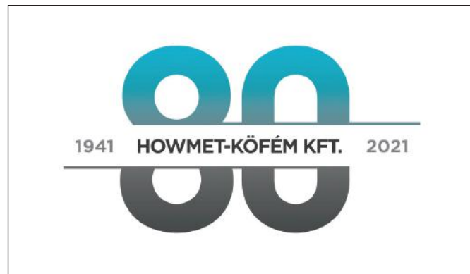
Idén ünnepli az egykori székesfehérvári Könnyűfémű 80. születésnapját

A Kőfém 80 éves, de ünnepel valamennyi üzletágunk is. 1996-ban jött létre Magyarországon a Shared Service és ebben az évben alapították meg mind a nem-szociális Fastenings (egy-