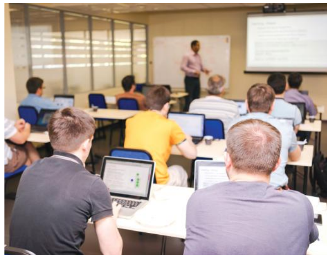
Várjuk az elhivatottságot érző szakemberek jelentkezését

A kamarai gyakorlati oktató képzés az NFA-KA-ITM-9/2020/TK/07, Innovációs és Technológiai Minisztérium támogatási szerződés keretében valósul meg. Felnőttképzési engedélyszám: E/2020/00243