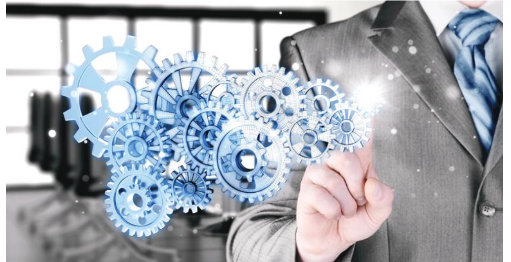
Az innovatív munkahelyek és képzett munkaerő biztosításáért lehet pályázni, március 2-ig

További információ a kiíró szervezet honlapján, a www.ofa.hu oldalon érhető el.