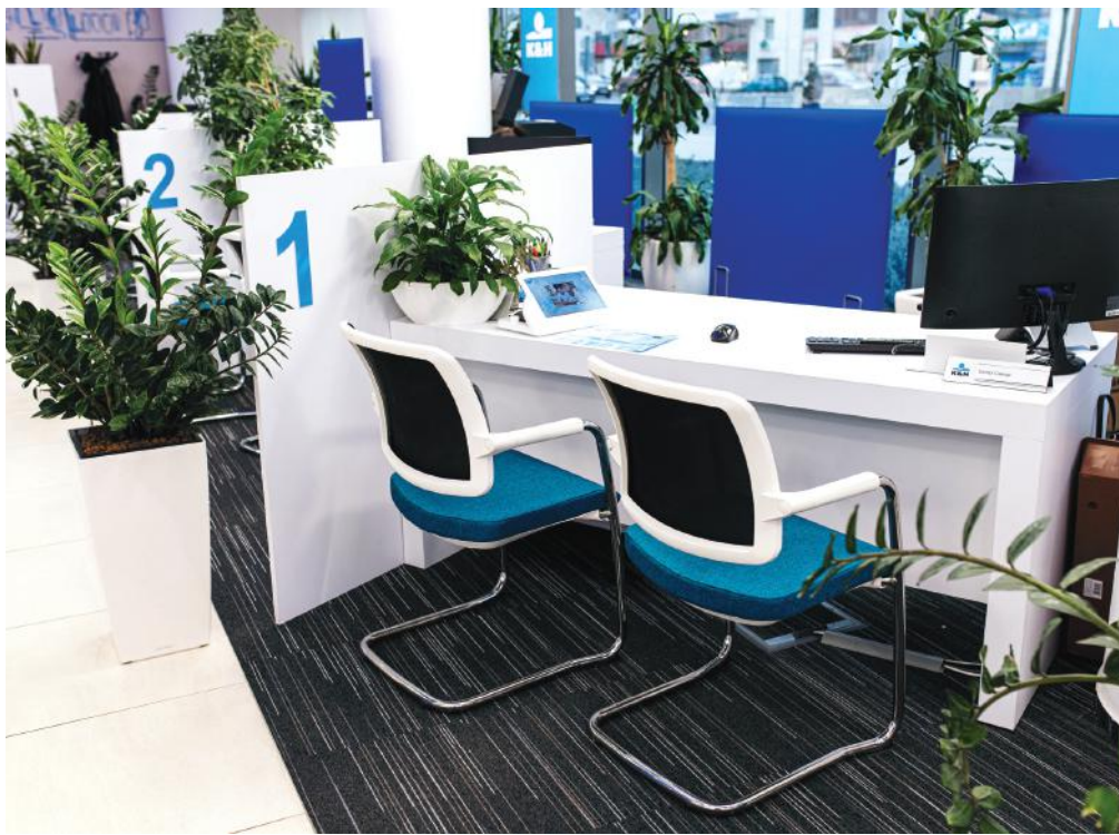
Idén 25 éves a Karrier Bútor Kft.