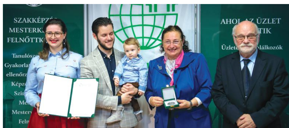
Etikus Vállalat Díjat kapta a Möllmann Ház

A díjazott vállalkozás is bemutatkozik a Gazdasági Körkép 2019 kiadványban.