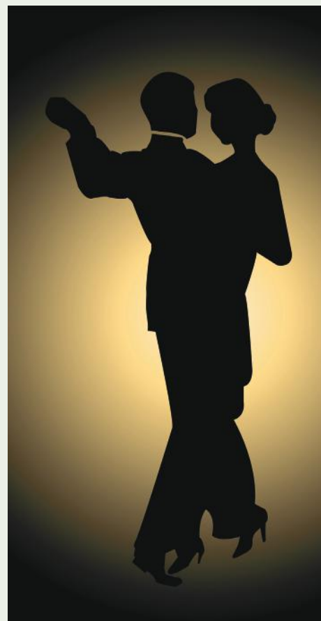
Már fogadjuk a jelentkezéseket a kamarai bálra

Minden érdeklődő, régi és új bálozó jelentkezését várjuk.