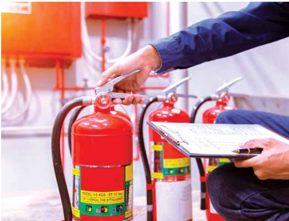
Január 22-től hatályos az új Országos Tűzvédelmi Szabályzat

A témában tájékoztató tértismentes rendezvényt tartunk 2020. február 13-án, csütörtökön, 14,00 órai kezdettel a Gazdaság Házában. Résztletek és jelentkezés az fmkik.hu honlapon.