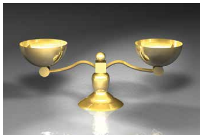
A békéltető testületek hatáskörébe a fogyasztók jogvitája tartozik

A februári Gazdasági Kalauzban részletesen tájékoztatjuk a lap olvasóit, milyen módon kell a panaszügyeket dokumentáltan benyújtani.