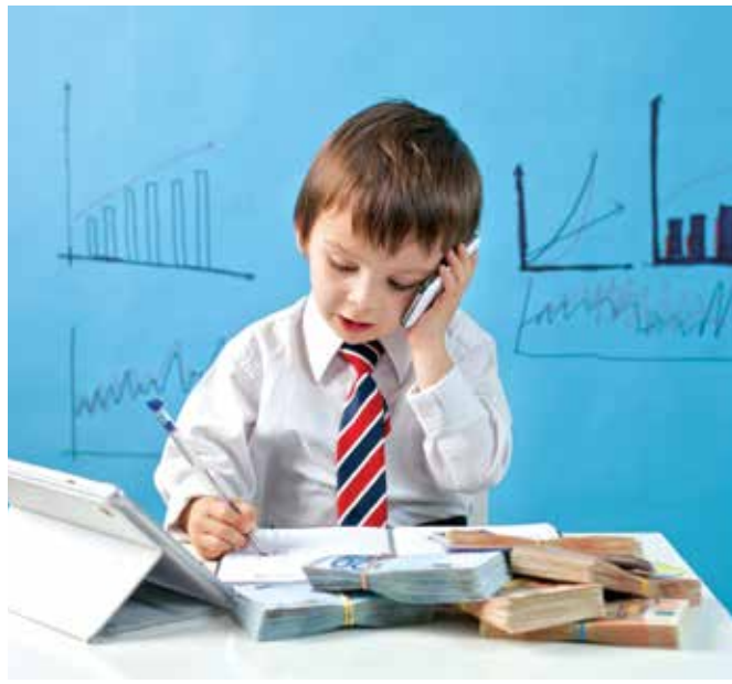
A tanulói juttatás a megemelkedett minimálbér alapján számítható

A minimálbér a 2020. évben bruttó 161.000 Ft-ra emelkedett, a kötelező legkisebb munkabér (minimálbér) és a garantált bérminimum 2020. évi megállapításáról szóló 367/2019. (XII. 30.) Korm. rendeletben rögzítettek szerint. A tanulói juttatás összegét 2020 januári hónapra a megemelkedett minimálbér alapján kell megállapítani. Ezt követően a 2020. februári juttatásnál figyelembe kell venni a tanulószerződés 11. pontjában megadott szempontrendszer és újabb emelést kell megállapítani a tanulószerződésben foglaltaknak megfelelően. Információ: szakkepzes@fmkik.hu; 06 22/510-310