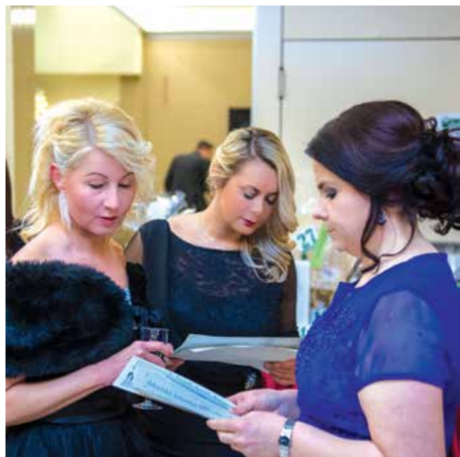
A gazdaság szezonnyitó báljára január 24-én kerül sor

Fókuszban a fiatal vállalkozók közössége, ismerjen meg új, lehetséges üzlettársakat!