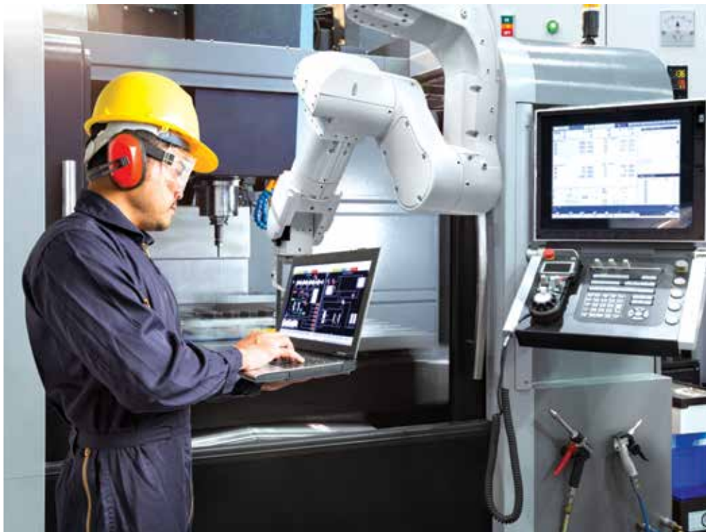
Várjuk szakemberek jelentkezését mestervizsga felkészítő tanfolyamunkra