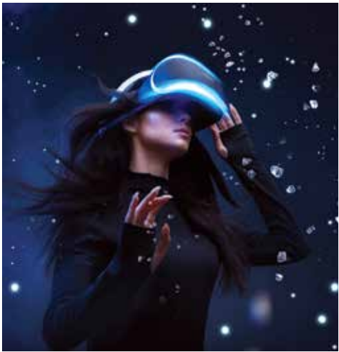
Kvv-k pályázhatnak Ipar 4.0 alkalmazások fejlesztésére

Voucher rendszer keretében kvv-k pályázhatnak Ipar 4.0 alkalmazások fejlesztésére az élelmiszeriparhoz kapcsolódóan. Az élnyerhető támogatás cégenként 60 000 euró. Konzorciumban nagyobb projektletek is benyújthatók. A felhívások hamarosan a www.s3food.eu weboldalon lesznek megtalálhatók.