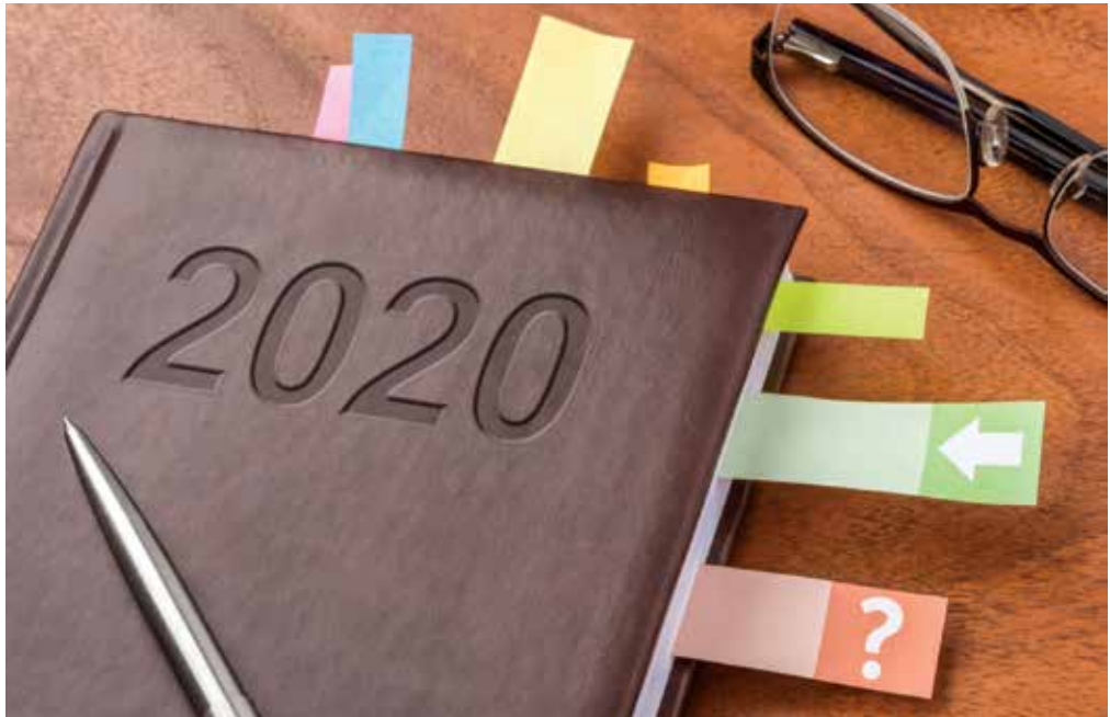
A programokról részletesen a kamarai honlapon olvashat: fmkik.hu

Részletes programajánló, további információ honlapunkon: www.fmkik.hu