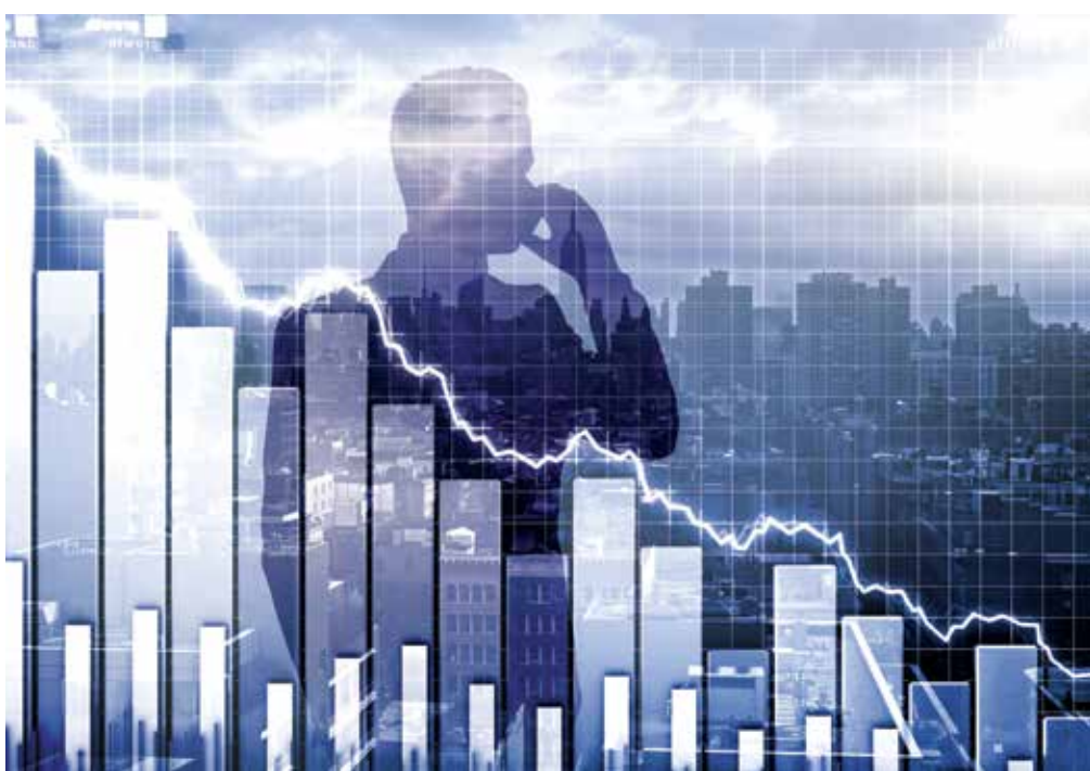
Ilyen helyzetre emberemlékezet óta nem volt példa, az egyszerű hétköznapokkal is meg kell birkóznunk

Többpontos gazdasági intézkedéscsomagot dolgozott ki a kormány, mely tartalmazza többek között a hitelfizetési kötelezettségek év végéig történő felfüggesztését, mind magánszemélyekre, mind pedig vállalkozásokra vonatkozóan. A helyzet mindenkit kihívások elé állít, türelmet és összefo-