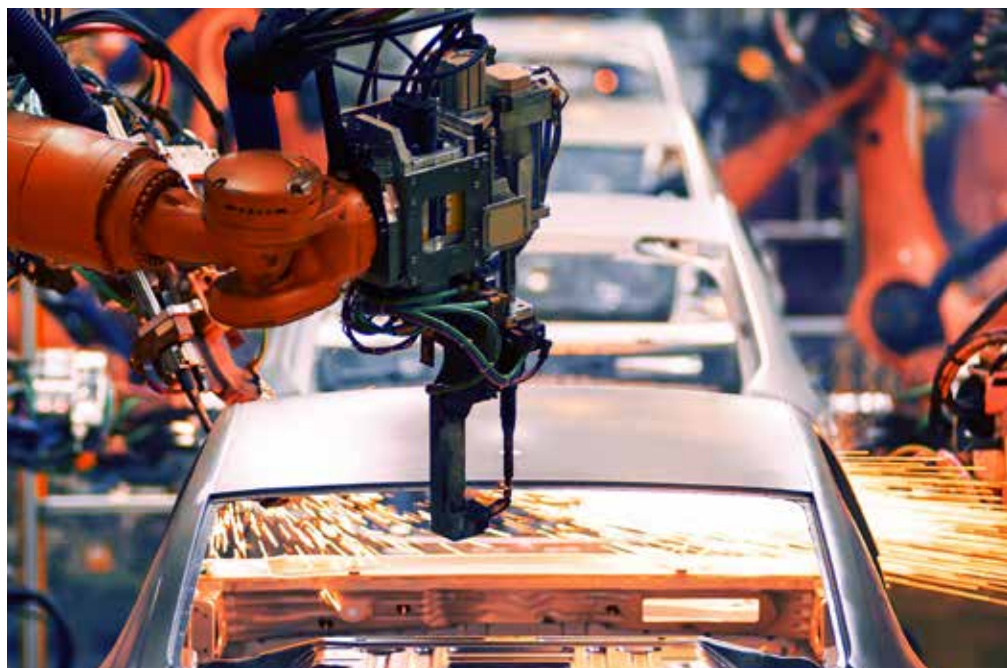
Magyarországon is több autógyár döntött a leállítás mellett