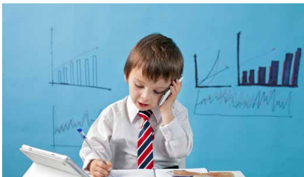
Minden tanuló számára biztosított tanulmányai folytatása és a tanév teljesítésének lehetősége

A veszélyhelyzet kihirdetéséről szóló 40/2020. (III. 11.) Korm. rendeletre, valamint „A koronavírus miatti új munkarend bevezetéséről a köznevelési és szakképzési intézményekben” című 1102/2020 (III. 14.) Korm. határozatra hivatkozva 2020. 03. 16-tól az intézményekben bevezetésre került a tantermen kívüli, digitális munkarend. Az új munkarenddel minden tanuló számára biztosított tanulmányai folytatása és a tanév teljesítésének lehetősége.