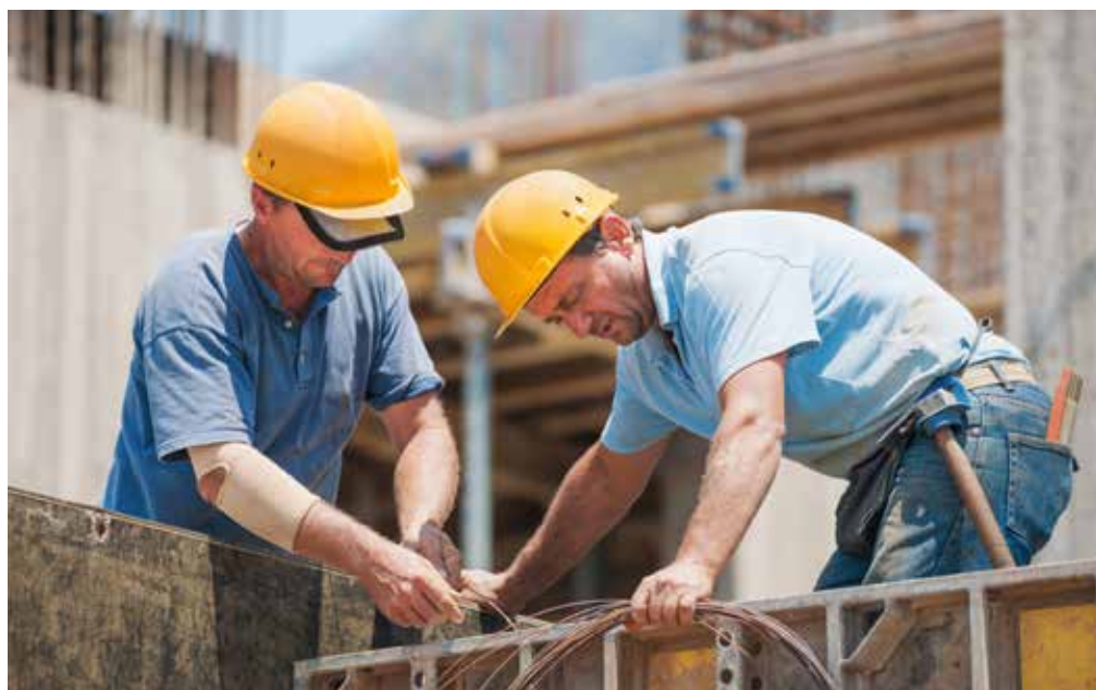
Változások lépnek életbe április 1-jétől a közigazgatási és munkaügyi perekben is