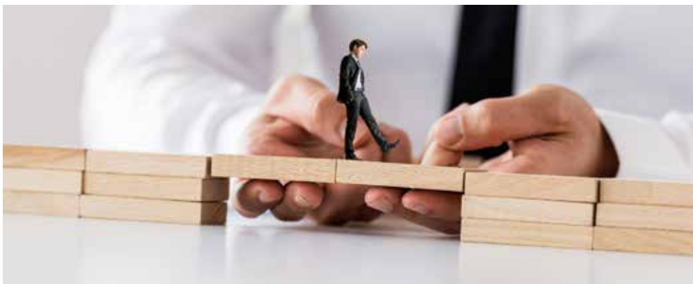
A moratórium szerint semmilyen költséget nem kell fizetni év végéig

A gazdasági intézkedéscsomag szerint minden magánszemély, minden vállalkozás szerda éjfélig megkötött hiteleinek tőke-, és kamatfizetési kötelezettségeit az év végéig felfüggesztik. A fizetési moratórium minden hitel- és kölcsönszerződésre, pénzügyi lízingszerződésre vonatkozik. A moratórium szerint semmilyen (tőketörlesztés, kamat, hiteldíj) költséget nem kell fizetni a jelzett dátumig.