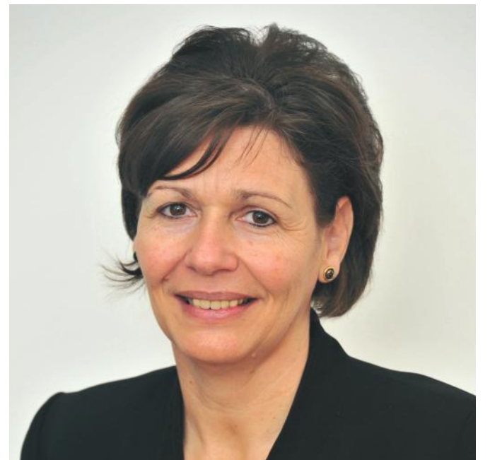
Pölöskei Gáborné, szakképzésért felelős helyettes államtitkár, Innovációs és Technológiai Minisztérium

A jó szakismeret átadása csak egy korszerű, a gazdaság igényeihez igazított szakképzési rendszer fejlesztése mellett biztosítható. Nemzetgazdasági cél, hogy