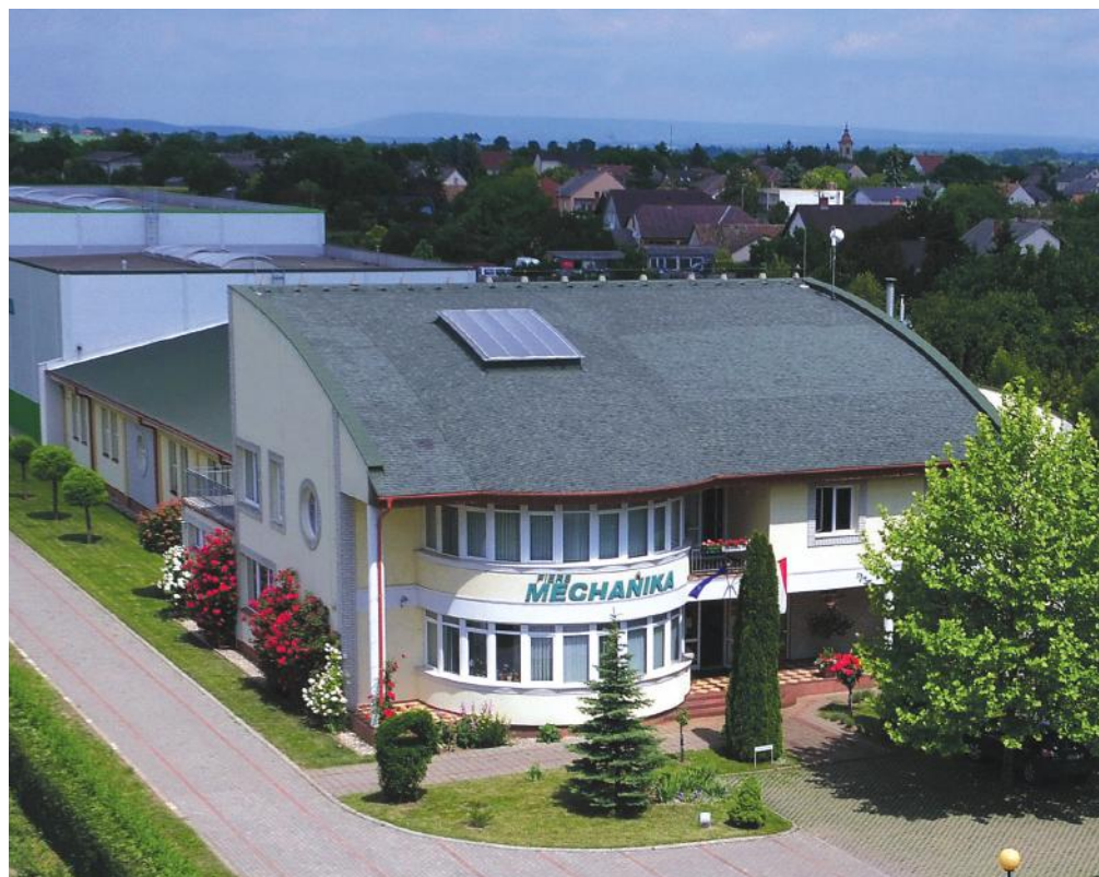
A szabadbattyáni Fiers Mechanika Kft.-nél már több, mint száz tanuló megfordult a duális képzés keretein belül