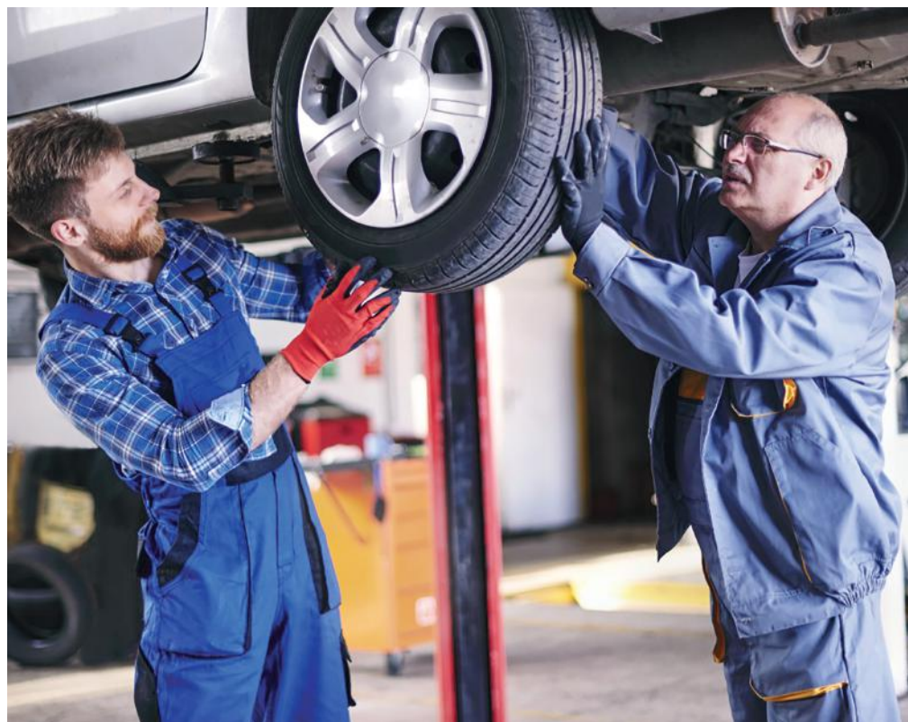
Autószerelés, mint életpálya (a fotó illusztráció)

A szakember azt is hangsúlyozta, hogy a gumibroncsok vagy kerekek cseréje előtt ellenőriztessük azokat. Az abroncsok, felnik mellett a féltengely és a gumiharang állapotát is érdemes megvizsgáltatni a szervizekben.