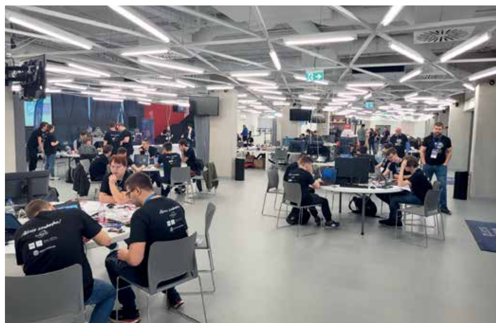
Középiskolások mérik össze tudásukat a Harman által szervezett országos versenyen

Ez év őszén középiskolásoknak hirdetett országos ötlet- és prototípusfejlesztő versenyt a cég, a székesfehérvári önkormányzat és az Óbudai Egyetem támogatásával. Öt fehérvári csapat jutott döntőbe, ahol egy 24 órás maraton versenyen kellett a középiskolásoknak helytállniuk. A szakmai verseny ezüstérmese a Lánczos Kornél Gimnázium csapata lett, a Székesfehérvári SzC Széchenyi István Műszaki Technikumának csapatai 4. 5. és 7. helyen