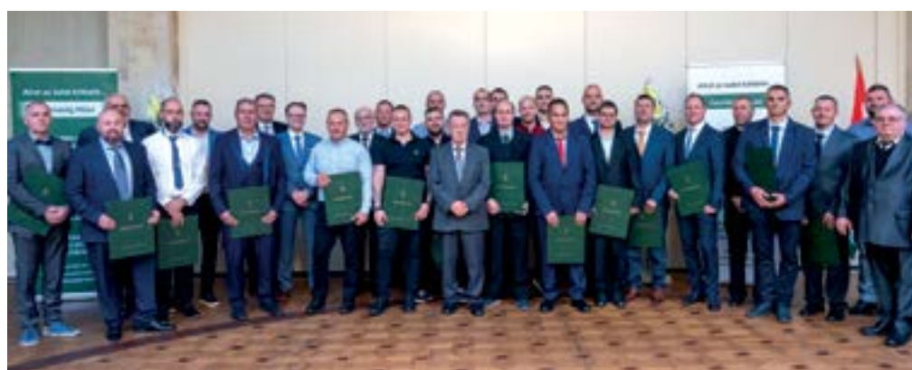
Autószerelő, ács, karosszérialakatos szakmában 27 mestert avatott az FMKIK