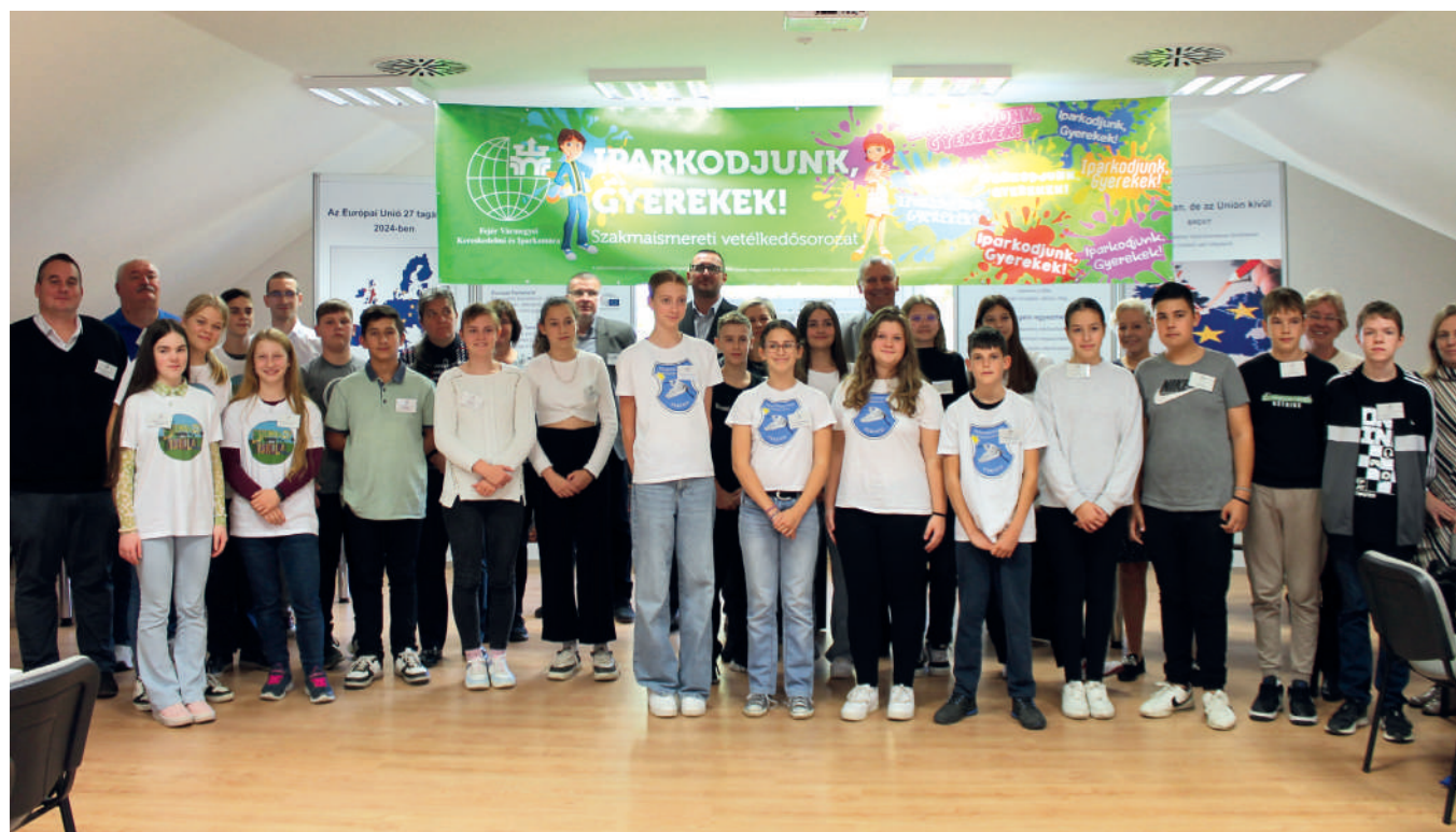
Bakonycsérnyei, pákozdi és nadasdladányi diákok szereztek meg a dobogós helyezeket a vetélkedőn

A pályaválasztási, pályaeorientációs tevékenység a Magyar Kereskedelmi és Iparkamara és a Fejér Vármegyei Kereskedelmi és Iparkamara között megkötött NFA-KA-KIM-6/2023/TK/07. számú közreműködői szerződés szerint valósul meg.