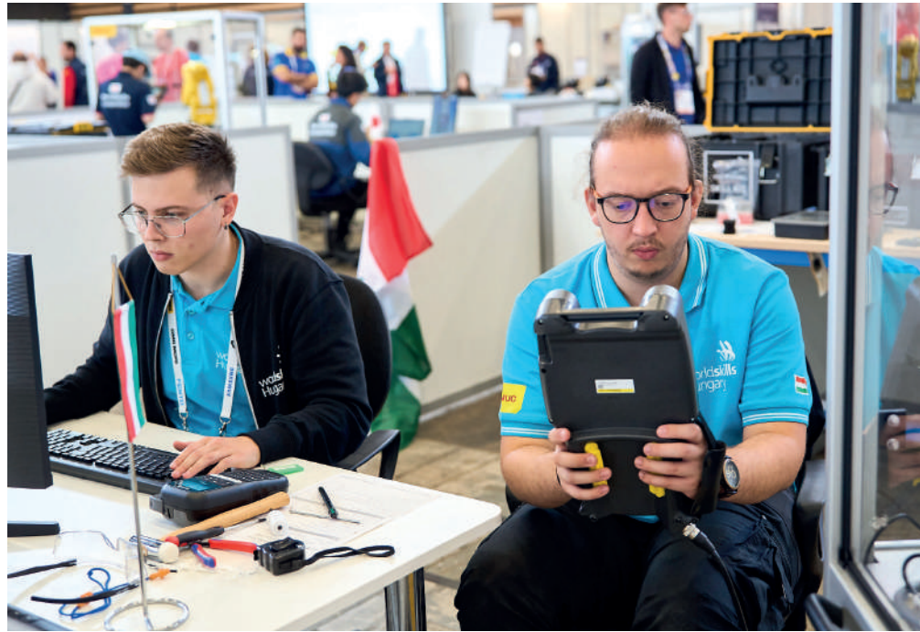
Kiválósági érmet szereztek Fejér vármegye fiataljai ipari robotika szakmában

Az elért eredmények bizonyítják a magyar szakemberek felkészültségét és szaktudását, hiszen a hazai csapat a nevezett 21 versenyszámból 15 szakmában érmmel zárta a versenyt,