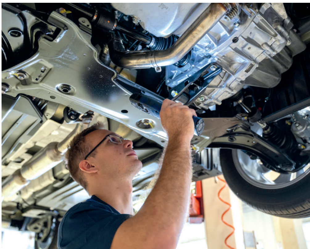
Korszerű gyártási, üzemeltetési és technológiai ismeretek gyakorlatából vizsgáznak az autószerelők